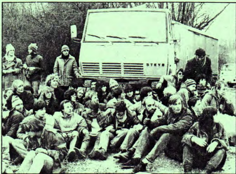
Sie blockierten den Konvoi der Holzfäller: ... in der Stopfenreuther Au

s just ungen ark in :plante t bisher e betei- ne Bun- lpark ist on Tirol, thalten; lete im eigenes rörter- en Lan- urg... n blieb t wird von